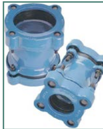
LEYA RACCORD UNIVERSEL TYPE 3100