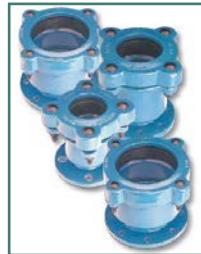
LEYA RACCORD UNIVERSEL À BRIDE TYPE 3200