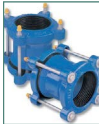
LEYA RACCORD UNIVERSEL À GRANDE TOLÉRANCE TYPE 1500